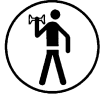
KRAFT & FITNESS