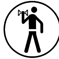
KRAFT & FITNESS